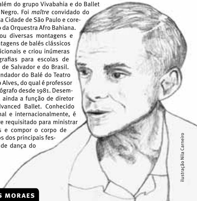
ilustração Nila Carneiro