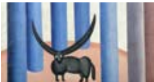
tarsila do amaral

Coleção MAM-BA – 50 Anos de Arte Brasileira Exposição de parte do acervo que narra os últimos 60 anos da história da arte no Brasil. 🏠 MAM 📍 71 3117-6132 🕒 até 28/3, ter a dom, 13h às 19h; sáb, 13h às 21h 🆓 Grátis 🏠 MAM